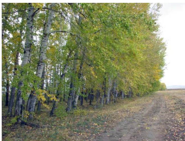
Рис. 3. Чистая по составу полезащитная лесополоса из тополя черного (окрестности пос. Соленоозерный, Ширинский р-н, Республика Хакасия).

Перечет деревьев в большинстве случаев выполнялся по двухсантиметровым ступеням. По числу деревьев ряды распределения соответствовали принципу достаточности (Вайс и др., 2005), т. е. превышали 200 наблюдений (вариант). Построение диаграмм выполнялось в электронной таблице «Excel». В дальнейшем был выполнен визуальный анализ рядов распределений на оценку устойчивости насаждений и выявление оптимальных агротехнических параметров защитных лесополос.