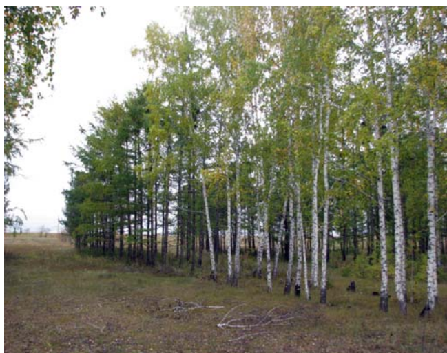
Рис. 1. Смешанная защитная лесополоса из березы повислой и лиственницы сибирской (Ширинский р-н, Республика Хакасия).