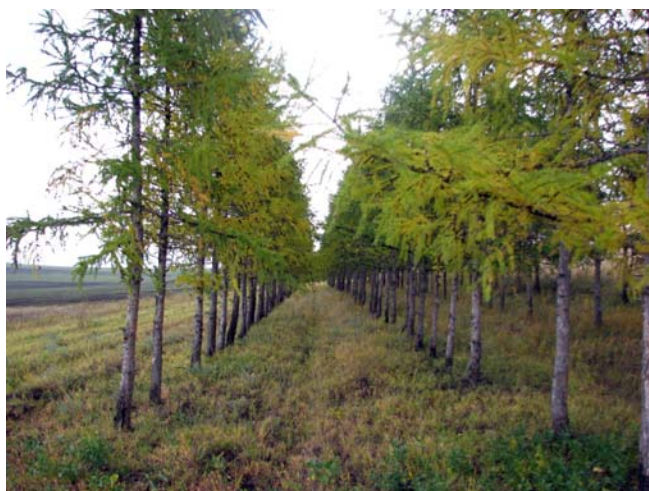
Рис. 2. Чистая по составу полезащитная лесополоса из лиственницы сибирской (окрестности пос. Соленоозерный, Ширинский р-н, Республика Хакасия).